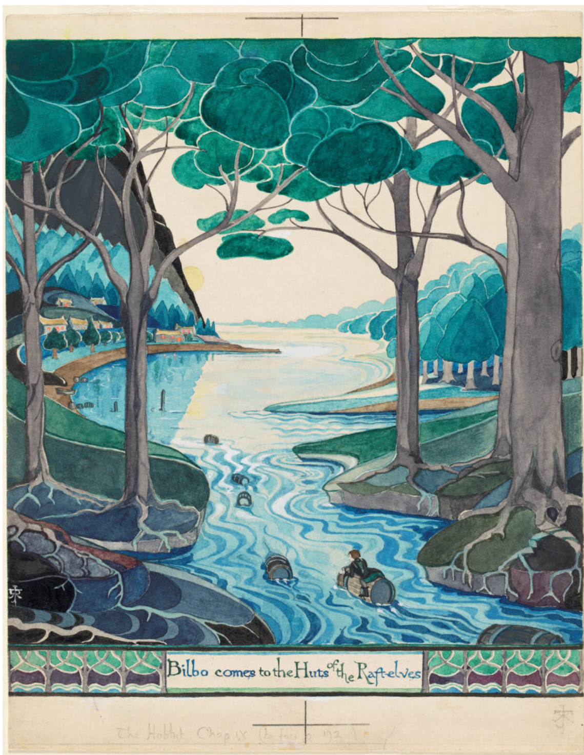
Bilbo comes to the Huts of the Raft-elves

Radici invisibili ha, più in alto degli alberi sta, lassù fra le nuvole va e mai tuttavia crescerà.