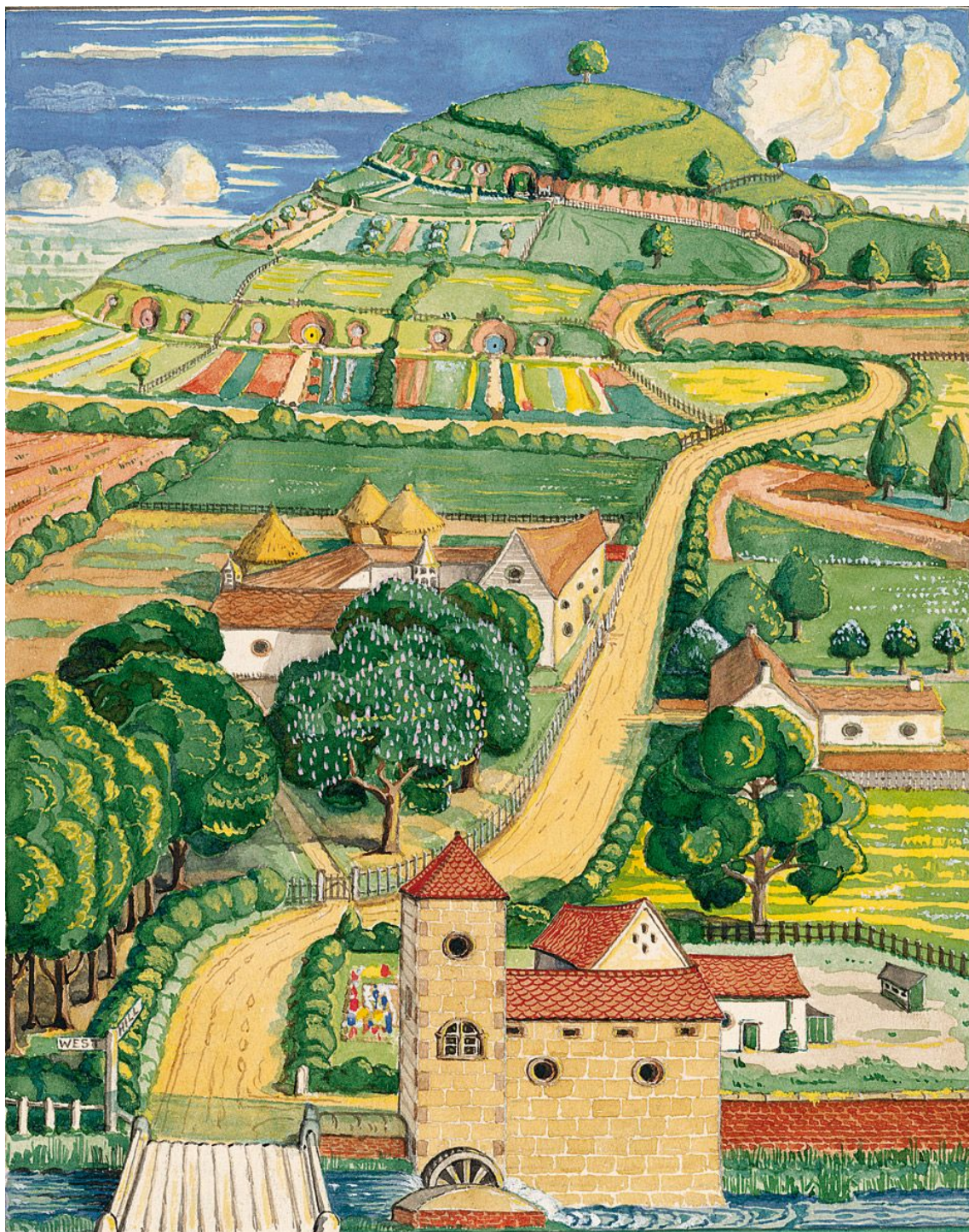
The hill : hobbiton~across~the Water

Un giorno un occhio in un azzurro viso vide un altro occhio dentro a un verde viso: «Quell'occhio è come me, però è laggiù, mentre il mio occhio se ne sta quassù».